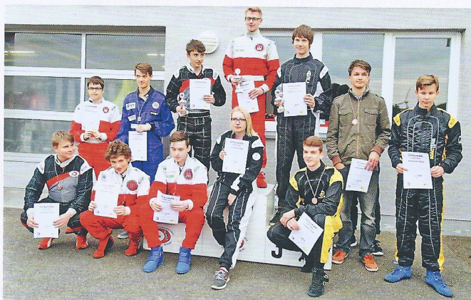
Die erfolgreichen Kart-Slalom-Fahrer