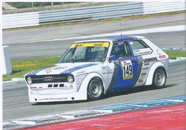
Audi 50, Baujahr 1976